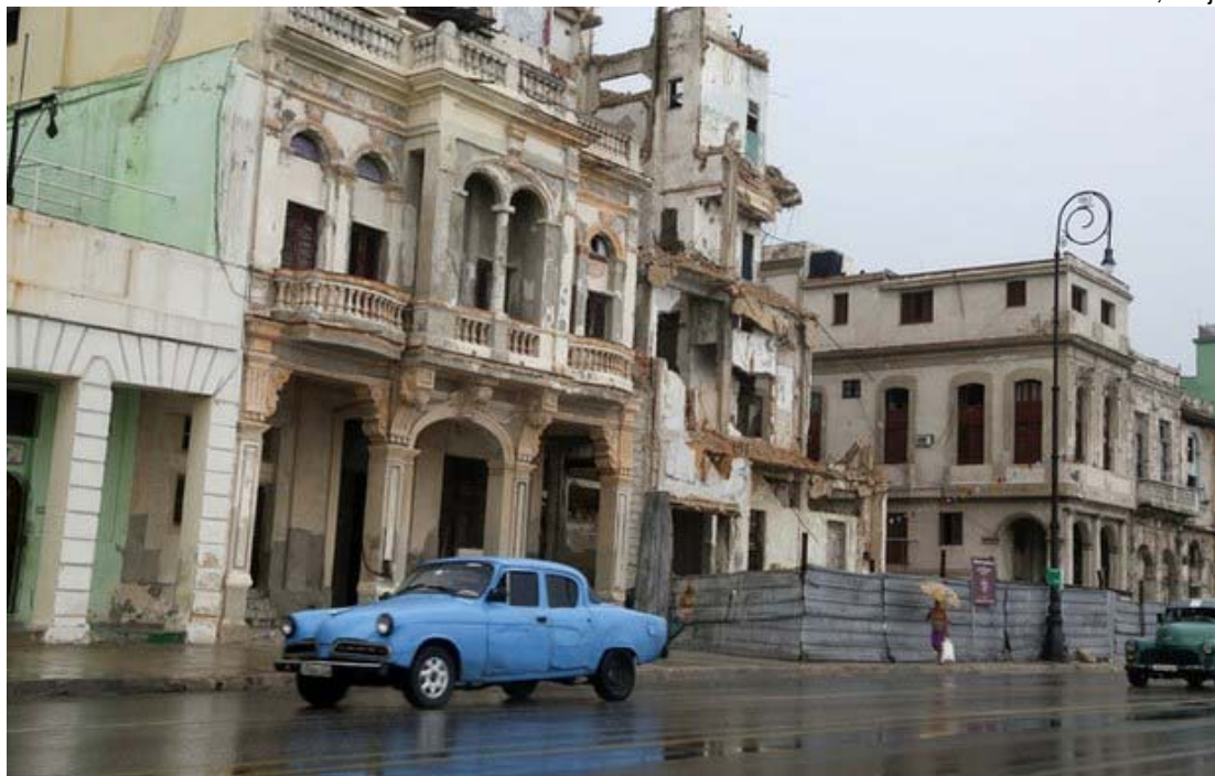
La emisora SiriusXM es la primera estación de EU que transmite en directo a Cuba.

La Habana. La emisora SiriusXM Radio se convirtió en la primera de Estados Unidos en transmitir un programa en directo desde Cuba en más de medio siglo, como parte del histórico deshielo entre los dos países, anunciaron este sábado el conductor del espacio y un medio local.