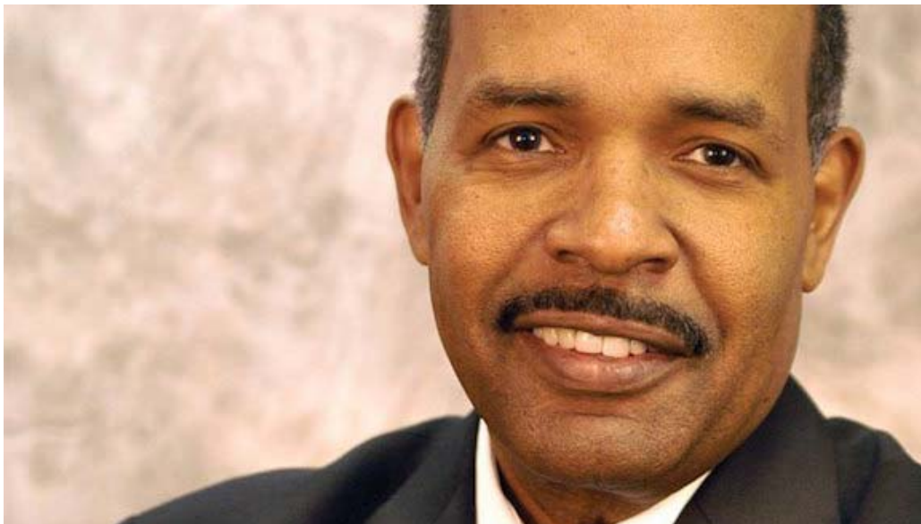
Joe Madison, anfitrión de SiriusXM.

Sirius XM Radio transmitió en vivo este jueves desde Cuba y se convirtió en la primera cadena nacional estadounidense que realiza un programa en directo desde la isla en más de 50 años.